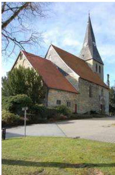
Ev. St. Pantaleon

Die Ev. Pfarrkirche St. Pantaleon in Lohne ist eine dreischiffige, zweijochige Hallenkirche mit gerade abgeschlossenem Chor. Der 40 m hohe Turm entstand in der ersten Hälfte des 12. Jh., das Langhaus und der Chor in der Übergangszeit von der Romanik zur Gotik um 1230. Turm und Kirche sind aus heimischem Grünsandstein geschaffen.