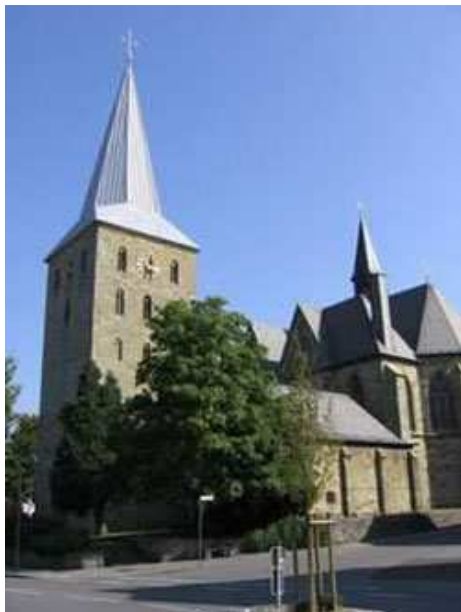
Pfarrkirche St. Pankratius Anröchte

Die heutige Pfarrkirche besteht aus einem romanischen Teil, der alten Dorfkirche mit einem auffallend mächtigen Turm. Kirche und Turm wurden in der Zeit zwischen 1180 und 1230 erbaut. Sie sind eigentlich vollständig erhalten. 1895 wurde ein neugotischer Erweiterungsbau errichtet.